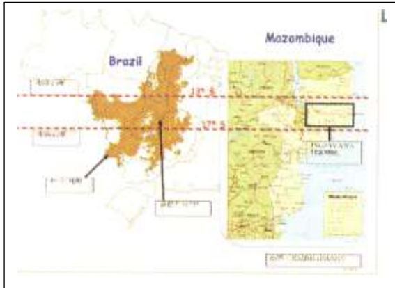
Mapa 1. Mapa da JICA distribuído durante simpósio (13 de Junho de 2012)

A área climática “savana tropical” é limitada a região Norte de Moçambique. Esta é uma das principais razões porque o Programa ProSAVANA almeja esta região. Para os planeadores do ProSAVANA, as similaridades geográficas entre o Cerrado e o Norte moçambicano são também evidentes como pode ser visto no mapa seguinte, que apresenta as mesmas latitudes das duas regiões. Este argumento é utilizado em quase todos os documentos da JICA sobre o ProSAVANA até agora.